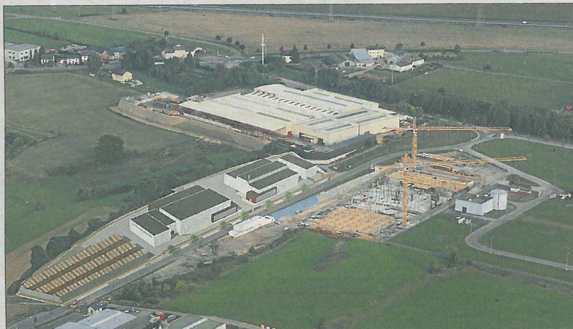
Kiowatt (Fotomontage, links) wird auf Roost neben Ameco (oben) und dem inzwischen fertiggestellten Datacenter (rechts) gebaut. Die Nähe zur Autobahn vereinfacht dabei die Versorgung mit Holz.

Die Wärmekraftkopplungsanlage soll Holzabfälle mit einer Wärmeleistung von 17 MW und